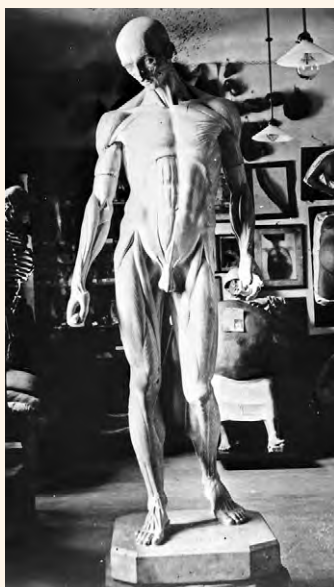
Constantin Brâncuși, Ecorșeu