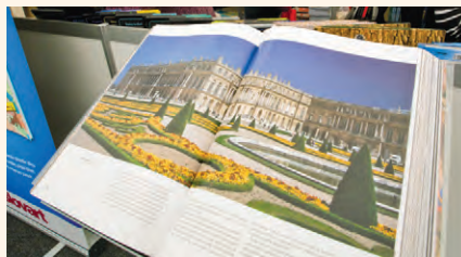
Cărțile de artă

Discutați în clasă despre cele mai potrivite metode de a descoperi cât mai multe informații despre artă.