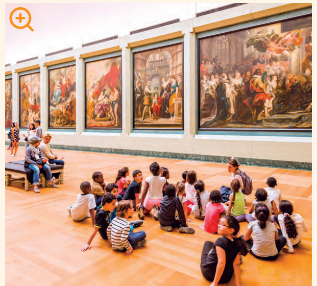
Vizita la muzeu