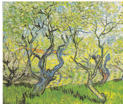
Vincent van Gogh, Livadă înflorită (detaliu)

Orice imagine artistică este o compoziție vizuală. Pentru realizarea unei compoziții armonioase se aplică un sistem logic în alcătuirea elementelor. Armonia se referă atât la potrivirea elementelor între ele, cât și la potrivirea tuturor elementelor într-un ansamblu unitar. Putem regăsi compoziții vizuale pretutindeni în desene, picturi, sculpturi, fotografii, afișe, filme, teatru, arta video.