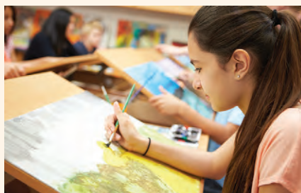
Oră de Educație plastică