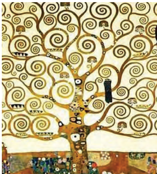
Gustav Klimt, Arborele vieții (detaliu)

Priviți detaliul extras dintr-o lucrare semnată de Gustav Klimt. Ce caracteristici observați?