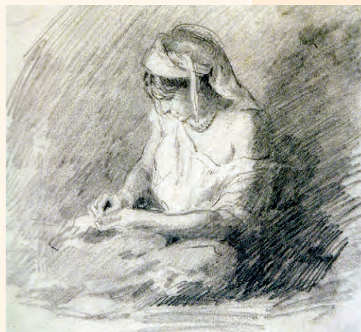
Nicolae Grigorescu, Țărancă alegând grăunțe