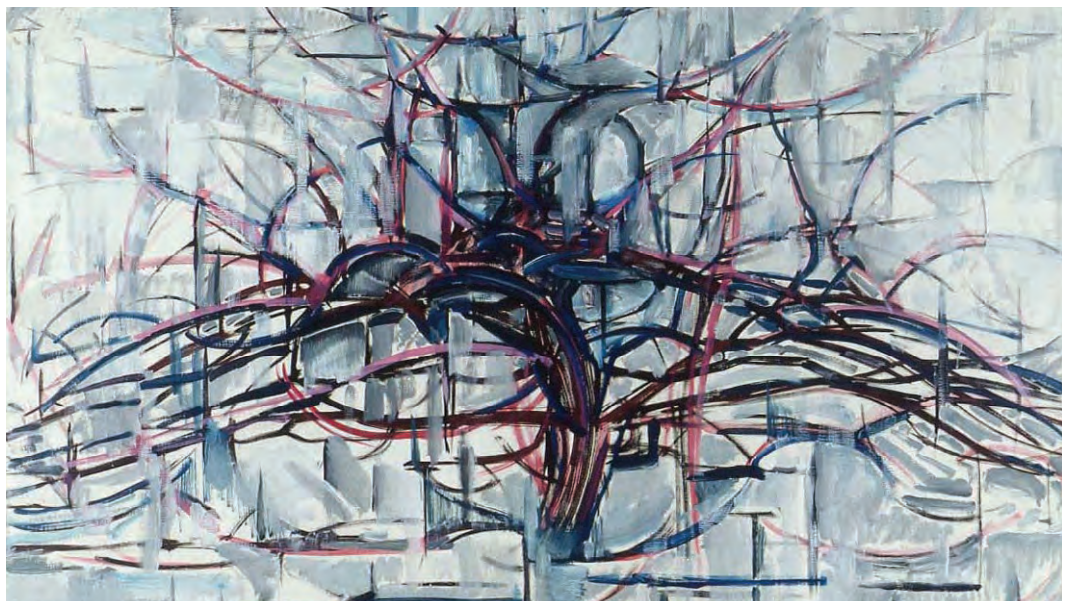
Piet Mondrian, Arbore gri

Observând elementele din natură, remarcăm particularitățile fiecăruia și faptul că împreună construiesc un tot unitar. Arborele este un element natural care se individualizează puternic; de asemenea, aspectul său se schimbă în funcție de anotimp. Reprezentarea plastică a arborelui va prelua forma lui naturală. Spațiul compozițional este organizat adecvat, așa cum se observă în lucrarea de mai jos, semnată de Piet Mondrian.